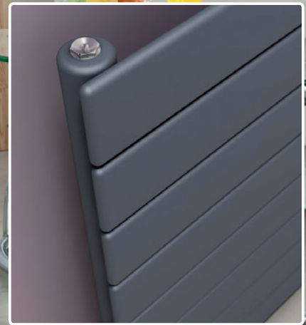
Gris Antracita / Simple